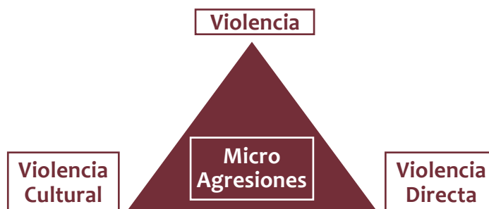
Figura 1. Integración de teoría de micro agresiones con el Triángulo de la violencia de Galtung