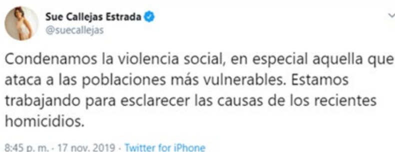
Figura 3. Posición oficial de la ministra de cultura de El Salvador respecto a la ola de crímenes por odio contra la población LGBTIQ+ a finales del año 2019