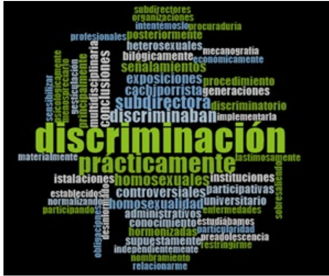
Figura 2. Nube de nodo de análisis relacionados con la niñez y la adolescencia